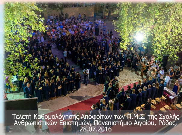
Τελετή Καθομολόγησης Αποφοίτων των Π.Μ.Σ. της Σχολής Ανθρωπιστικών Επιστημών, Πανεπιστήμιο Αιγαίου, Ρόδος, 28.07.2016

Α' & Β' εξάμηνο: παρακολούθηση 8 μαθημάτων Γ' εξάμηνο: Πρακτική Άσκηση και 2 μαθήματα Δ' εξάμηνο: Μεταπτυχιακή Διπλωματική Εργασία