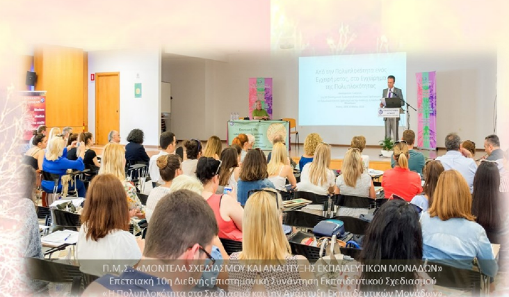
Π.Μ.Σ.: «ΜΟΝΤΕΛΑ ΣΧΕΔΙΑΣΜΟΥ ΚΑΙ ΑΝΑΠΤΥΞΗΣ ΕΚΠΑΙΔΕΥΤΙΚΩΝ ΜΟΝΑΔΩΝ» Επτελεστική 10η Διεθνής Επιστημονική Συνάντηση Εκπαιδευτικού Σχεδιασμού «Η Πολυπλοκότητα στο Σχεδιασμό και την Ανάπτυξη Εκπαιδευτικών Μονάδων»