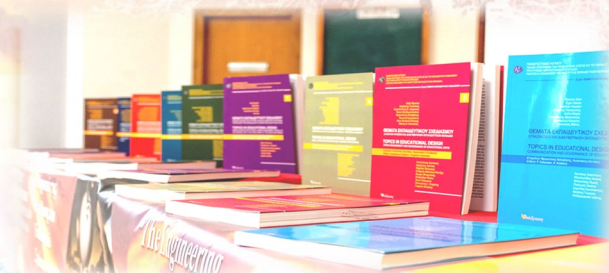
Σειρά: Θέματα Εκπαιδευτικού Σχεδιασμού

Εμπλουτισμός των τυπικών μορφών διδασκαλιών (διάλεξη-εργαστήριο-φροντιστήριο, προσομοίωση, μικροδιδασκαλία, κλπ):