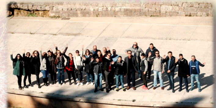
Μεταπτυχιακοί φοιτητές και μεταπτυχιακές φοιτήτριες ακαδ. έτους 2017-18

Διοργανώνονται εναλλάξ ένα «Γενικό Σεμινάριο-Εργαστήρια» και η «Επιστημονική Διημερίδα Εκπαιδευτικού Σχεδιασμού με διεθνή συμμετοχή» που περιλαμβάνουν θεματικές ενότητες όπως π.χ. Εκπαιδευτικό Δίκαιο, Διαλεκτική Συμβουλευτική, Διαχείριση Ειδικών Πληθυσμών- Ατομα με Ειδικές Ανάγκες, Εκπαιδευτική Ηγεσία, Διαχείριση Ειδικών Πληθυσμών- Πολυπολιτισμικές Ομάδες, Εφαρμογές και Παραδείγματα Εκπαιδευτικής Έρευνας η/ και άλλες επίκαιρες θεματικές. Στις δραστηριότητες αυτές φιλοξενούνται αναγνωρισμένες/οί εισηγήτριες/ές από το επιστημονικό πεδίο του Εκπαιδευτικού Σχεδιασμού και νέοι/ες επιστήμονες. Η διάρκεια και η οργάνωση εξαρτώνται από τις διεθνείς συγκυρίες και εξελίξεις στο επιστημονικό και ακαδημαϊκό χώρο του αντικείμενου του Π.Μ.Σ.